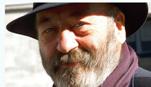
RAINER KAMPLING

Wie oft hat die Prinzessin das von ihrem Vater schon gehört: „Kind, mit vollem Mund spricht man nicht.“ Doch Prinzessin Lora hört lieber das, was sie hören möchte. Und überhaupt, all die Anweisungen „Tu dies nicht, tu das nicht“ gehen ihr mächtig auf die Nerven. Lora möchte Abenteuer erleben und die Welt außerhalb der Schlossmauern entdecken. Leider ist ihr Vater viel zu beschäftigt, um mit zu bekommen, was seine Tochter wirklich braucht. Und deshalb merkt er auch nicht, dass sich Lora auf die Reise macht, um des Königs Reich zu erkunden. Auf dem Weg erlebt sie so einige Abenteuer!